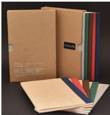
YD-Afra - 13.5*21