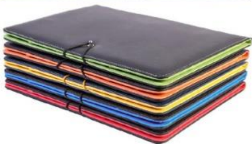
FP02 – size A4