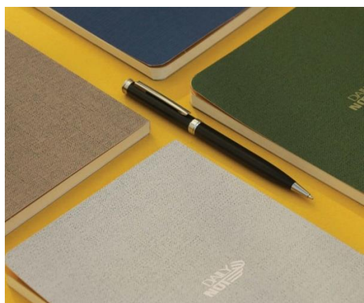
YR-NARM - 13.5*20