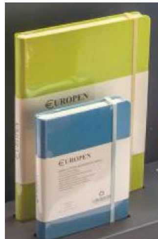
YG7701- 14.4*21 - 10*14.4