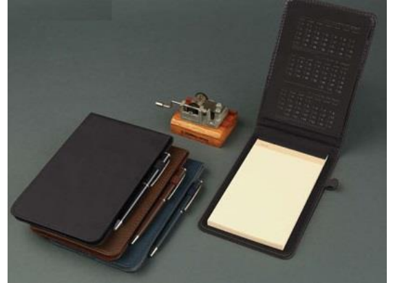
YR-Hamrah - 10*15