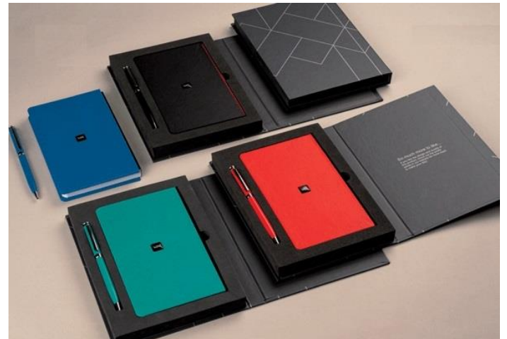
SETR-Sepehr - 14.5*20