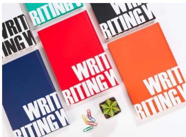
YR-Hard - 14*21