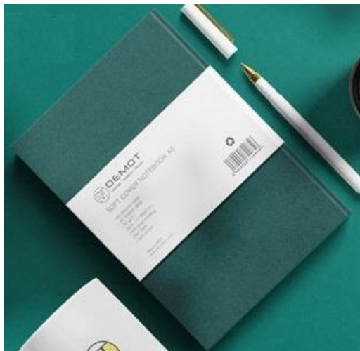
YD-Danush - 13*21