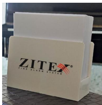
NR78 (H33)- 7*10.5