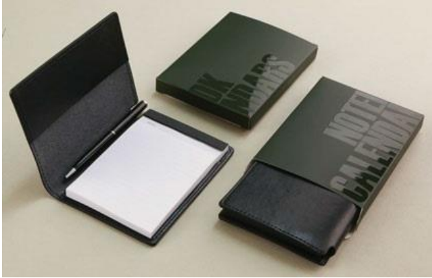
YR-Yekta - 9*12