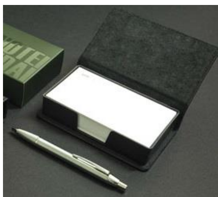
YR-HIVA - 13*8