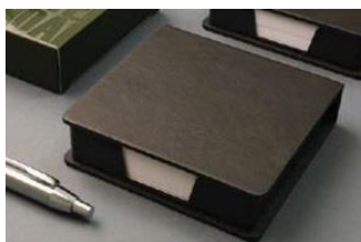
YR-BORNA - 11*11