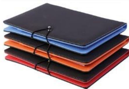
FP01 – size A5