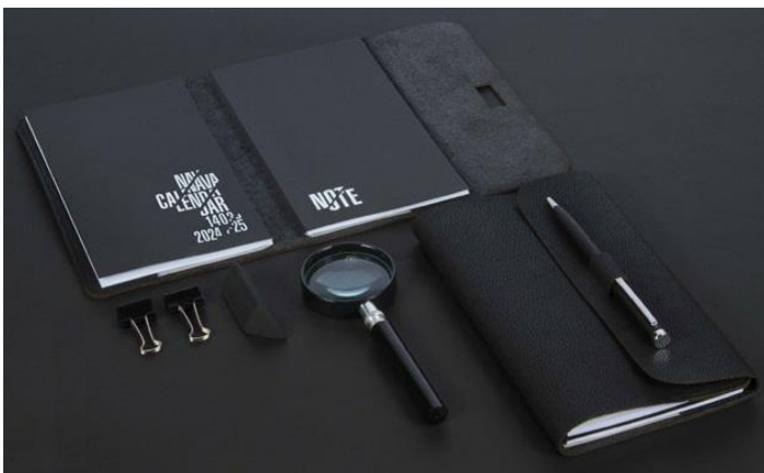
SPR-Nava - 12*19