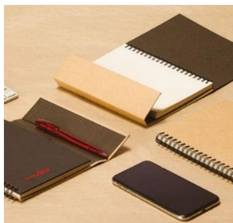
YD-Sana - 12*18