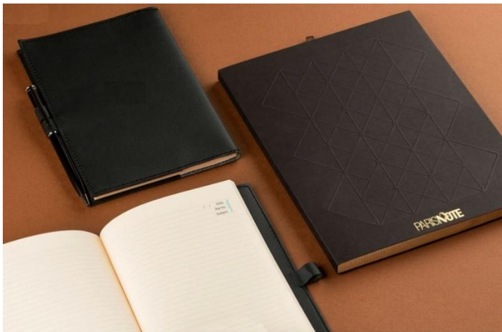
SETR-Paris - 13*18